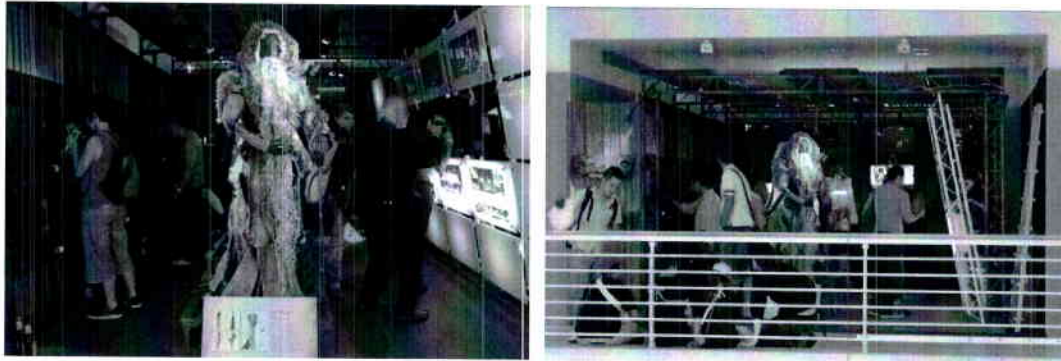
圖為 PQ 2011 臺灣學生館於布拉格展出實況。